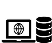
PC / Server